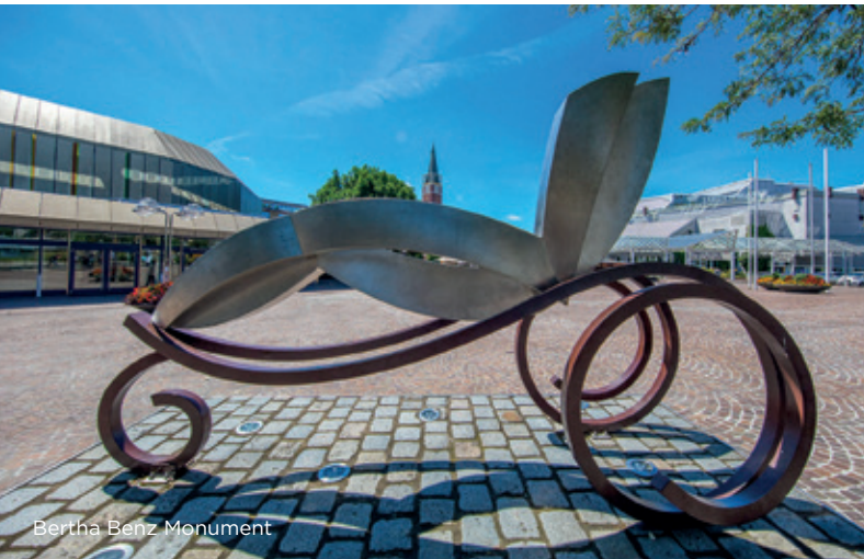
Bertha Benz Monument