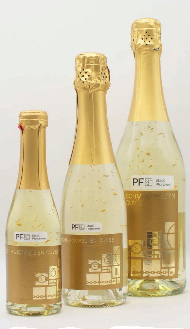
Edle Tropfen aus Pforzheim