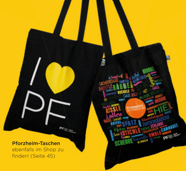
Pforzheim-Taschen ebenfalls im Shop zu finden! (Seite 45)