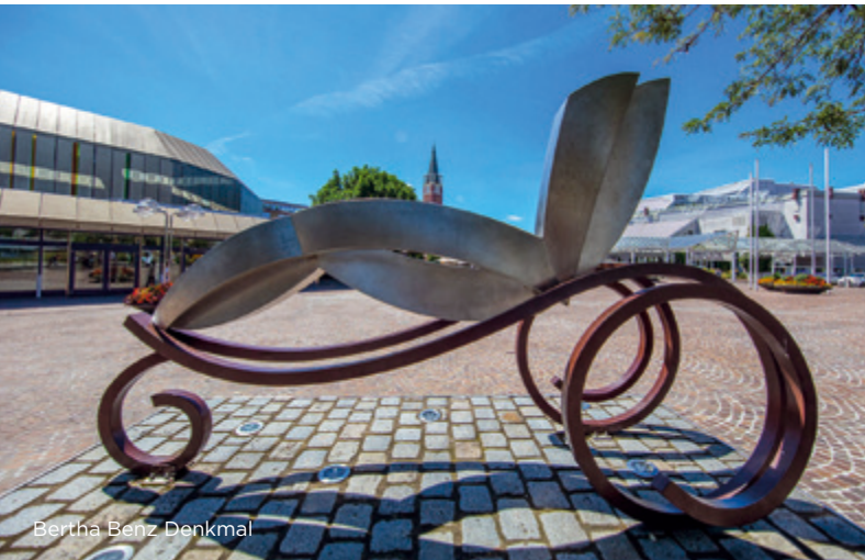
Bertha Benz Denkmal